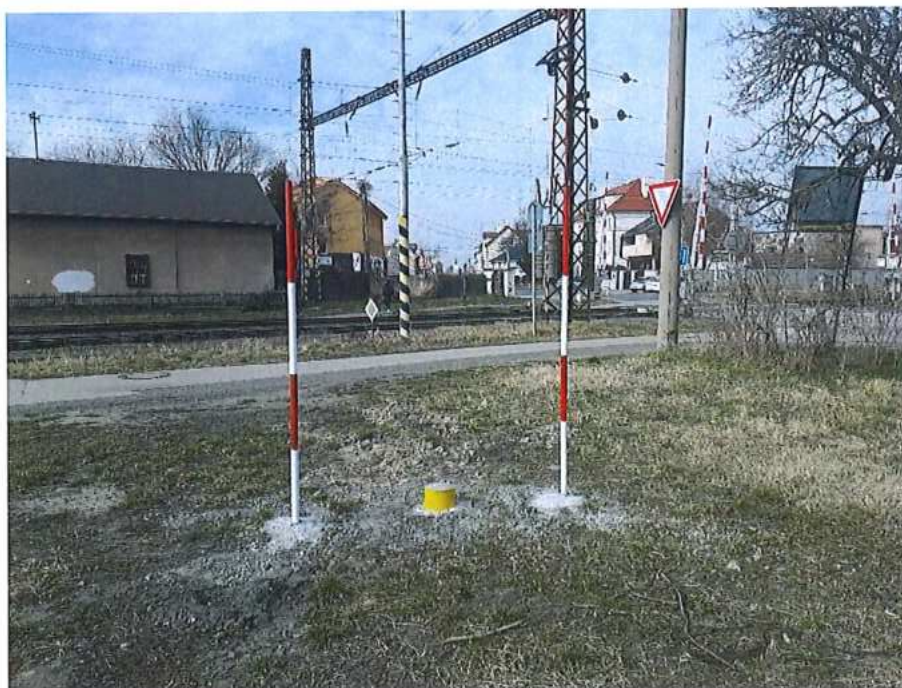
Bodovanie ZVS – Malacky km. 24,865