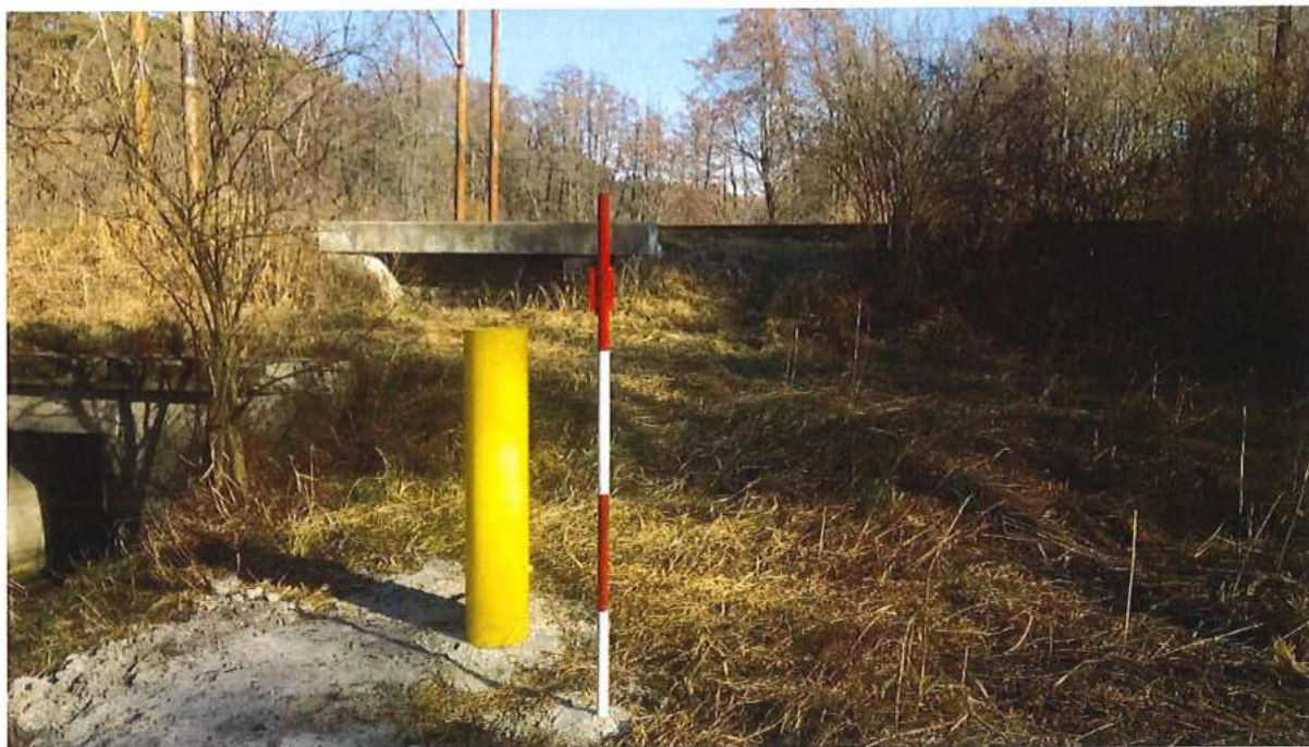
obr. 2 , úsek DNV - Malacky, žst. Zohor žkm 12.43, pilier- bod ZVS