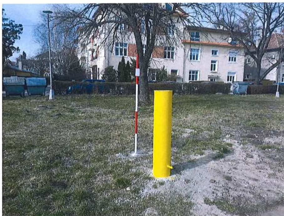
Bodovanie ZVS – Malacky žkm. 25,140