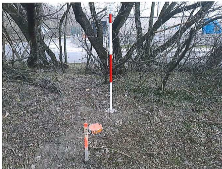
Bodovanie ZVS – Malacky km. 23,825